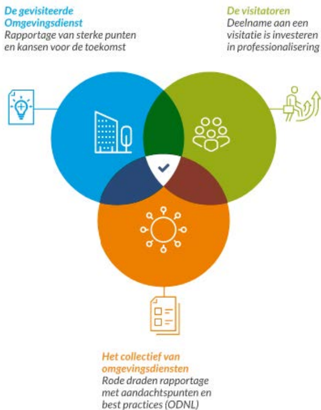
Figuur 1: Leren op drie niveaus

Dit stelt ons in staat om op drie niveaus te leren, zoals weergegeven in figuur 1.